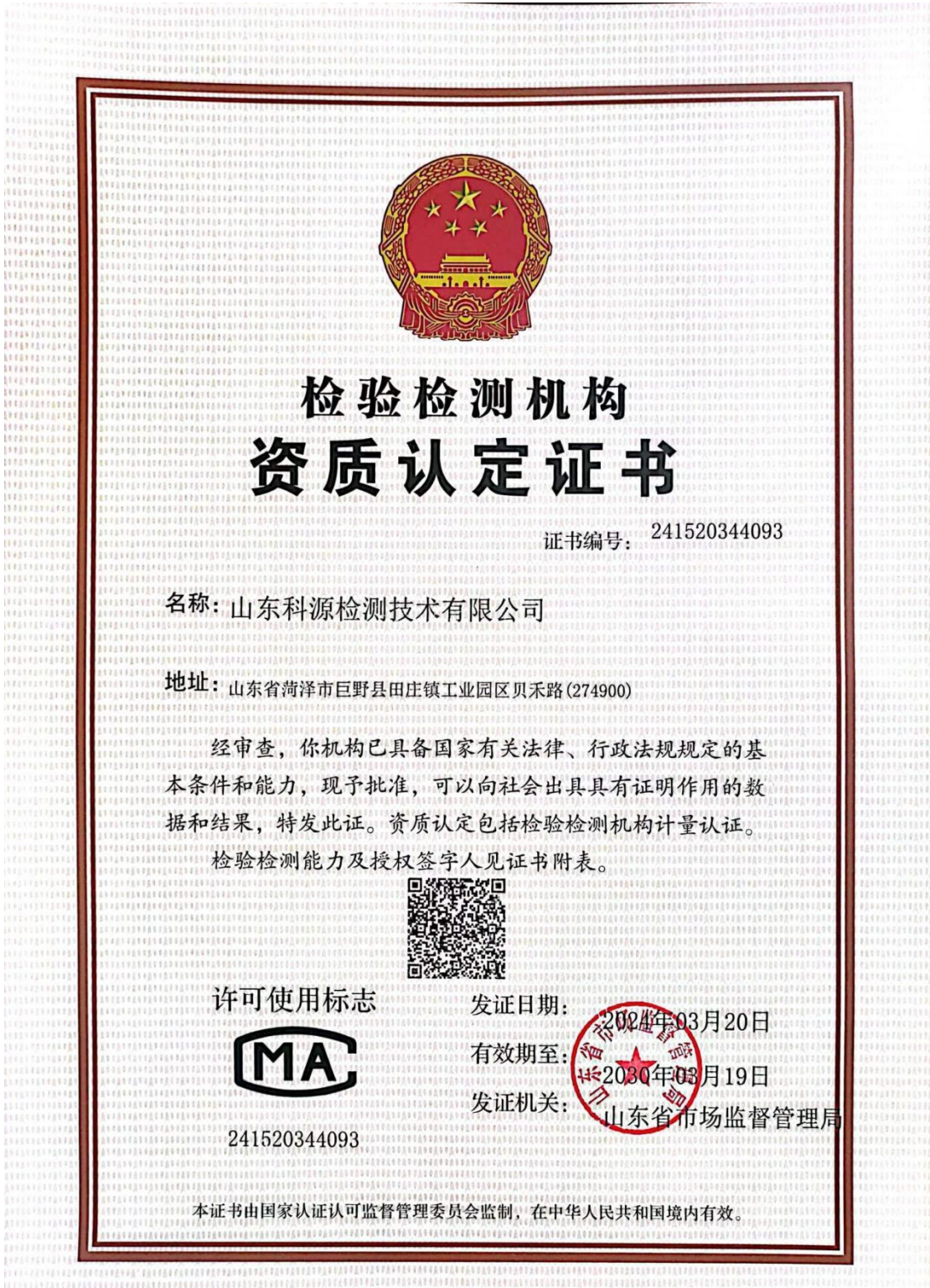
附图 2：检测单位资质